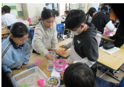
4 年キャノン出前授業