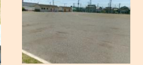
運動場の雑草が近年の課題です。そんな中、ダディーズの方が重機を入れて整美をしてくださいました。