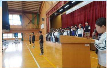
6年生交通安全リーダー任命式では、保護者の前で交通安全の誓いを宣言しました。最高学年として、在校生みんなの命を守る意識が芽生えたようです。