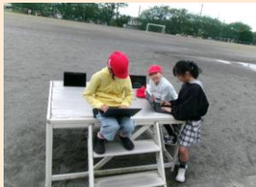
5年生の理科では、雲の流れをクロムブックで録画しています。タブレット端末を上手に活用して学んでいます。