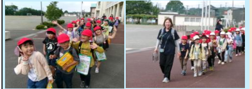
1・2年生の校外学習です。バスに乗って神山自然公園へ行きました。仲良く活動ができました。