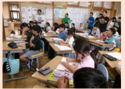
3年生の算数の学習です。答えをどのように導き出したかクラスのみんなに説明しています。