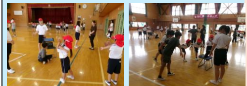
6年生が1年生にみなみっ子体操を教えています。1年生も6年生をお手本にして一生懸命覚えていきます。