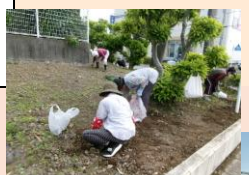
校地内の草刈り・畑整備・夢と輝きの教育推進・学校運営協議会など、南小は多くの方に支えられて学校活動を行っています。