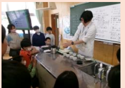
5年生のお茶の入れ方教室です。お茶を淹れるときのお湯の温度でお茶の味わいが変わることを学習しました。