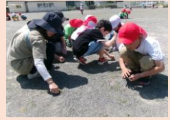
運動場の草取りです。みんなで使う運動場をみんなできれいにしています。暑さに負けず頑張るみなみっ子です。