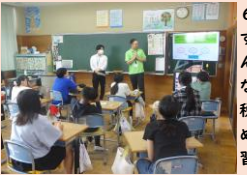
6年生の租税教室です。税金がないとみんなの暮らしはどうなるのか。税金はどのように集められているのか学習しました。