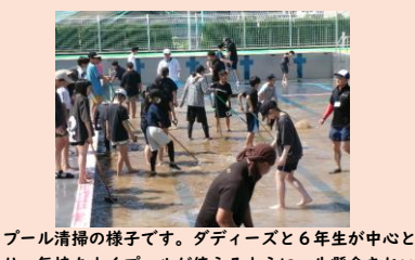
プール清掃の様子です。ダディーズと6年生が中心となり、気持ちよくプールが使えるように一生懸命きれいにしました。6月のプールびらきが楽しみです。