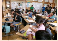
3年生の算数の学習です。答えをどのように導き出したかクラスみんなに説明しています。