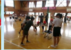
6年生が1年生にみなみっ子体操を教えています。1年生も6年生をお手本にして一生懸命覚えていきます。