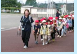
1・2年生の校外学習です。バスに乗って神山自然公園へ行きました。仲良く活動ができました。