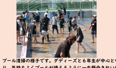
プール清掃の様子です。ダディーズと6年生が中心となり、気持ちよくプールが使えるように一生懸命きれいにしました。6月のプールびらきが楽しみです。