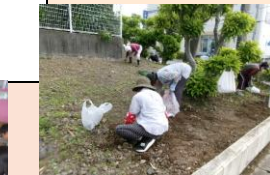
校地内の草刈り・畑整備・夢と輝きの教育推進・学校運営協議会など、南小は多くの方に支えられて学校活動を行っています。