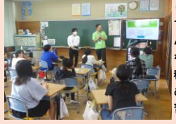
6年生の租税教室です。税金がないとみんなの暮らしはどうなるのか。税金はどのように集められているのか学習しました。