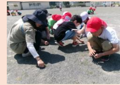
運動場の草取りです。みんなで使う運動場をみんなできれいにしています。暑さに負けず頑張るみなみっ子です。