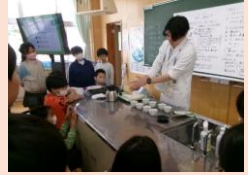
5年生のお茶の入れ方教室です。お茶を淹れるときのお湯の温度でお茶の味わいが変わることを学習しました。