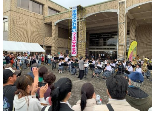
観客を魅了～産業祭で演奏する吹奏楽部

10月20日(日)、裾野市民文化センターにて産業祭が開催され、吹奏楽部が演奏会を行いました。裾野市商工会からの依頼で実現しました。当日は雨上がりで少し肌寒かったのですが、準備から司会まで自分たちで行い、頼りになる3年生が抜けて心細いところがあったかもしれませんが、むしろ、「3年生が抜けても、自分たちで頑張っってやっています！」というメッセージまで伝わってくるような演奏でした。学校内にとどまらず、地域で活躍する中学生を見ることは、とても喜ばしいことです。今後も、地域でのマンパワーとして活躍できる人に成長して欲しいと願います。