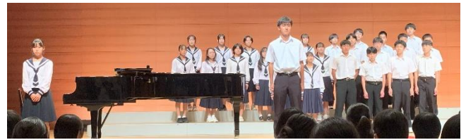
3年4組 「手紙～拝啓十五の君へ～」