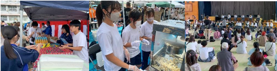
左から、福引ボランティア、ポップコーン売り、吹奏楽の演奏会

11月3日(日)、晴れ渡った空の下、東地区コミュニティ祭りが開催されました。多くの東中ボランティア