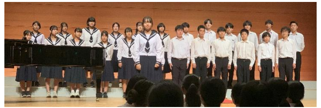
3年1組 「あなたへ～旅立ちに寄せるメッセージ～」

10月24日(木)、裾野市民文化センター多目的ホールにて、「令和6年度 第56回 裾野市中学校音楽会」が開催され、市内各中学校の代表が合唱を披露し、本校の代表もすばらしい歌声をホールいっぱいに響かせました。参加態度もすばらしく、盛り上げるところを盛り上げ、人の話をしっかりと聴く態度など、場をわきまえた立派な態度でした。それにしましても、歌声に感動したのは担任だけではないはずです。教育長が、合唱を「育てる」という表現をされていましたが、まさしく、生徒たちは合唱を「育て」、そして学級を「育て」てきたのだと思います。学校で行われている合唱コンクールは、Nコンに代表される合唱コンクールとは大きく異なります。Nコンなどは、合唱の得意な、好きな人たちの集まりですが、学校のものは、合唱が得意な人もいれば苦手な人も、好きな人もいれば嫌いな人もいることがほとんどです。そして講評にもあったように「偶然出会ったメンバー」が今の学級です。そのような学級が、お互いのことを思い、一生懸命合唱することのなんと尊いことか。たかが合唱されど合唱、合唱を育てることが学級を育てているのだと思います。そして受賞する・しないに関わらず、どの学級も育ててきたのではないのでしょうか。学級ごとにドラマがあり、いろいろなことを乗り越えての合唱だと思います。それらは世界で一番美しい合唱だと思います。